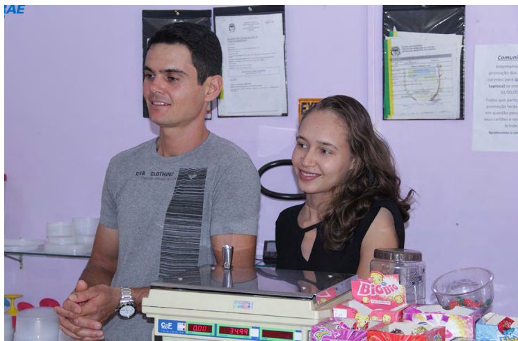
Negócio a Negócio do Sebrae orientará 200 empreendedores