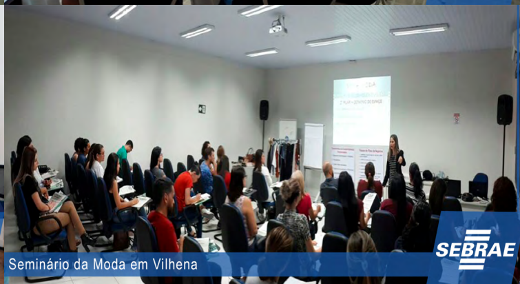
Seminário da Moda em Vilhena