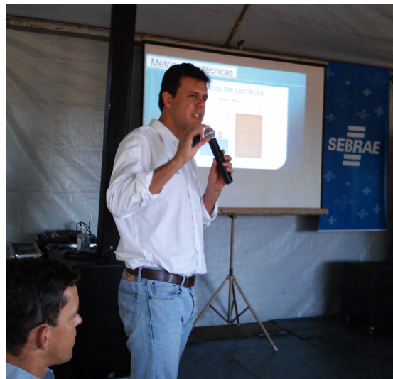
há uma demanda muito grande por produtos e serviços oferecidos pelo Sebrae nos espaços de atendimento