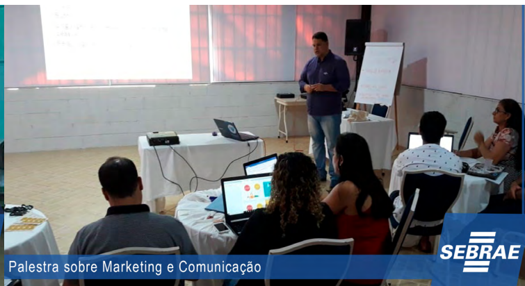
Palestra sobre Marketing e Comunicação