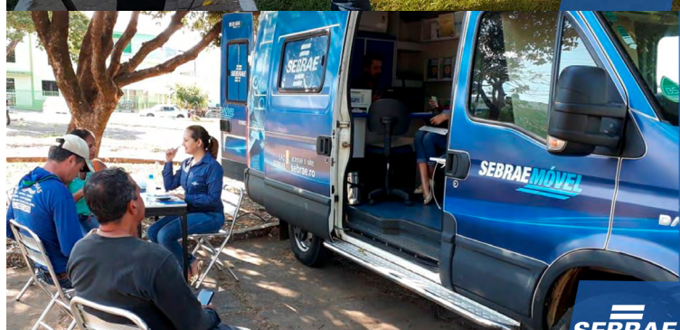
Itinerante em Ouro Preto