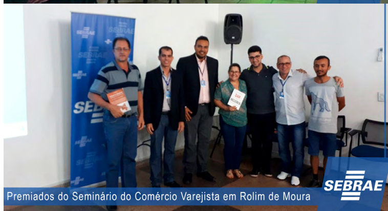
Premiados do Seminário do Comércio Varejista em Rolim de Moura