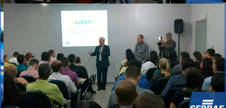
Lançamento do Projeto Líder em Ariquemes