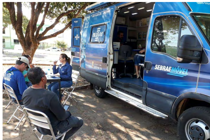
A unidade móvel com técnicos da Agência Sebrae de Ji-Paraná

gularidade fiscal das empresas. Também chamada de escritório itinerante, essa unidade dispõe de acesso à Internet e folders explicativos sobre gestão empresarial. Sua principal função é tirar dúvidas dos candidatos a empresários e dar informações sobre finanças, inovação, marketing, além de oferecer soluções empresariais aos que já estão no mercado. Para aqueles que desejarem abrir empresas o Sebrae. Continue na Íntegra .