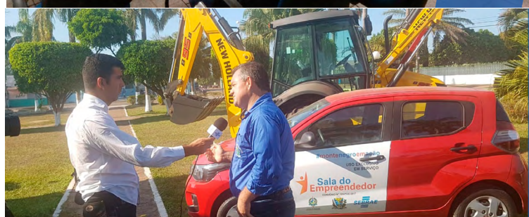
Entrega do carro para a Sala do Empreendedor em Monte Negro