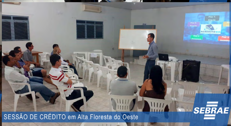
SESSÃO DE CRÉDITO em Alta Floresta do Oeste