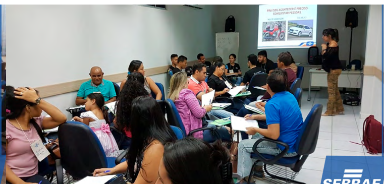
Curso Técnicas de Vendas