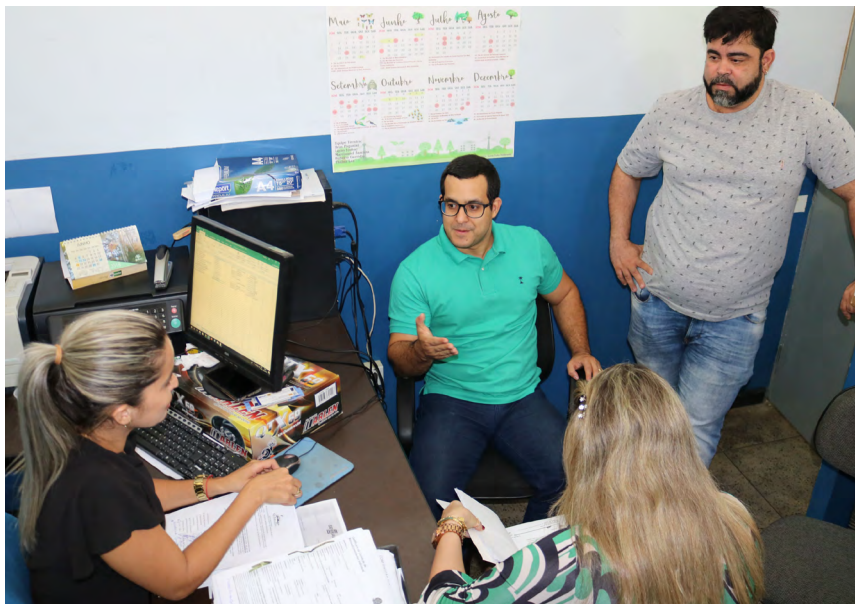
Compras governamentais ajudam a fortalecer as economias locais