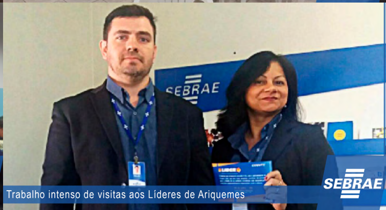
Trabalho intenso de visitas aos Líderes de Ariquemes