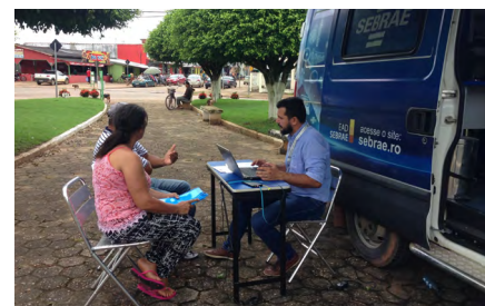
O Sebrae Itinerante estará em Ouro Preto do Oeste