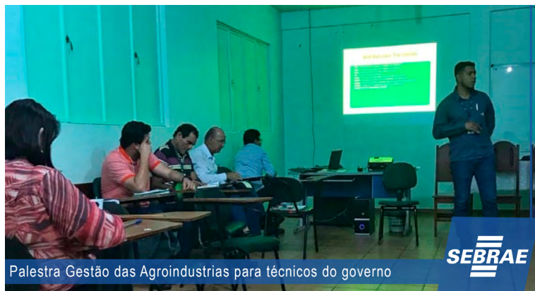
Palestra Gestão das Agroindústrias para técnicos do governo