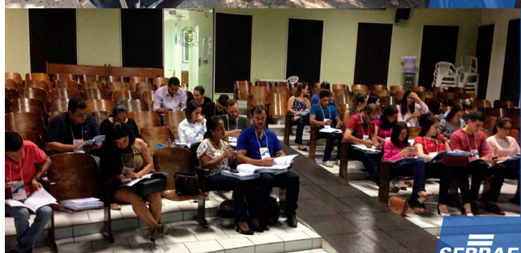
Oficina Sei Controlar em Ouro Preto