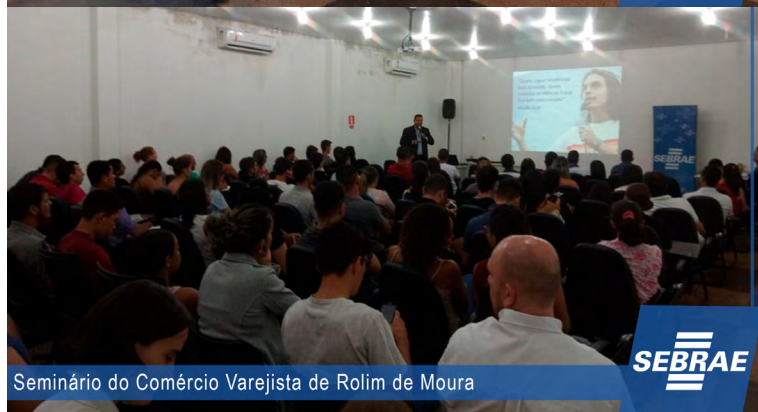
Seminário do Comércio Varejista de Rolim de Moura