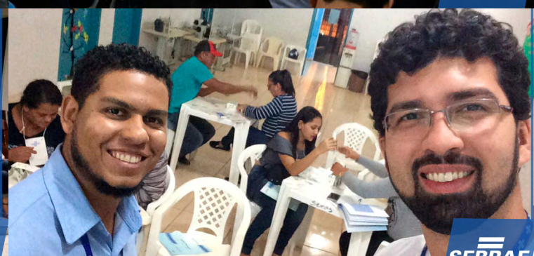
Oficina Sei Planejar em Cujubim