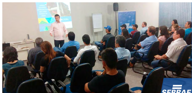
1ª palestra do Seminário Sustentabilidade Gera Lucro